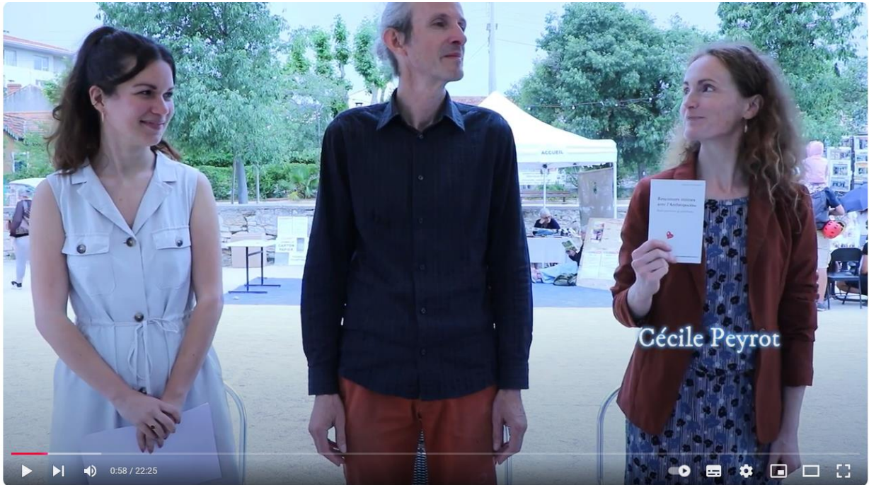
LA CIOTAT CULTURE 2024 - "Rencontres Intimes avec l'Anthropocène" CieTEXTE HORS CONTEXTE : Ciné Zooms